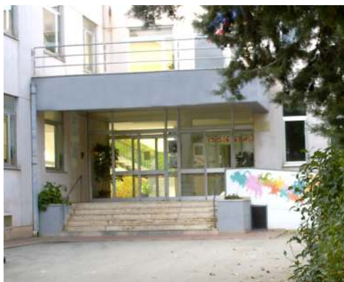
Scuola Secondaria di I° Grado "Gennaro Venisti"