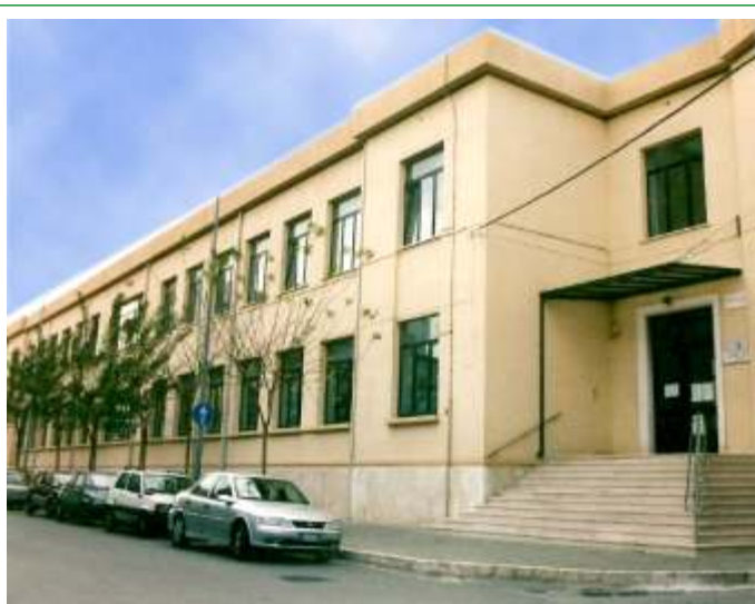
Scuola Primaria "S. Giovanni Bosco"