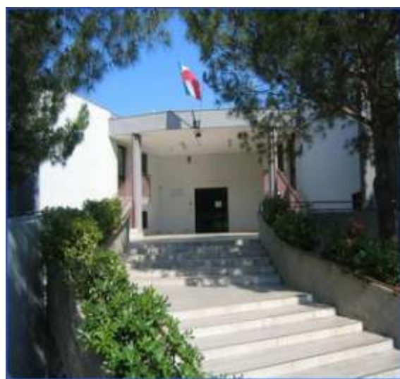
Scuola Primaria "S. Domenico Savio"