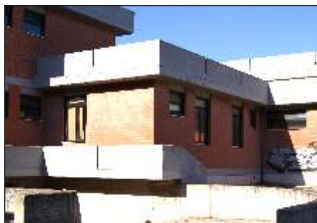
Scuola Secondaria di I° grado