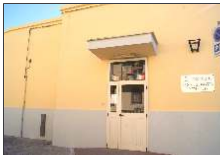
Scuola Infanzia "Giovanni Rodari"