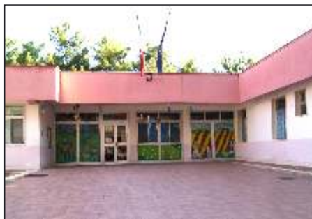
Scuola Infanzia "Carlo Collodi"