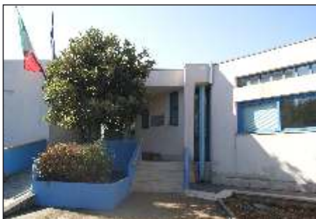
Scuola Infanzia "Madre Teresa di Calcutta"