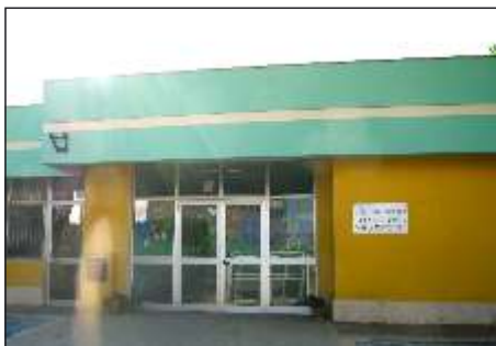
Scuola Infanzia "Maria Montessori"