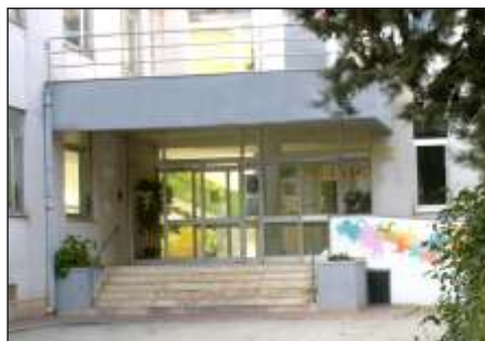
Scuola Secondaria di I° grado "Gennaro Venisti"