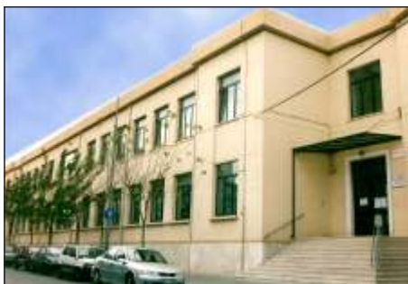
Scuola Primaria "San Giovanni Bosco"