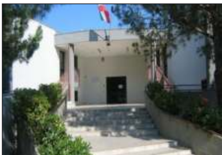
Scuola Primaria "San Domenico Savio"